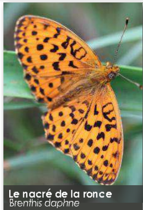
Le nacré de la ronce Brenthis daphne