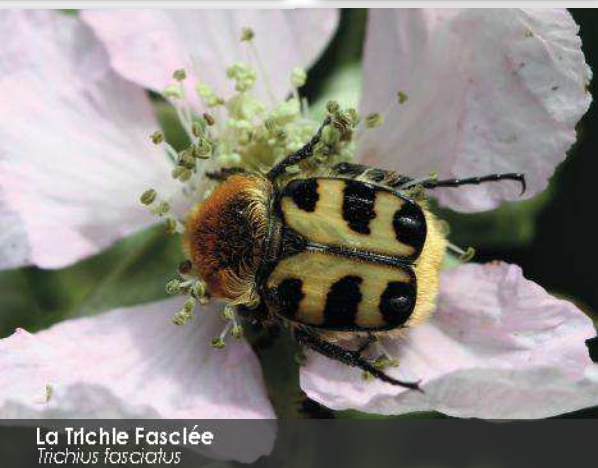
La Trichie fasciée Trichius fasciatus