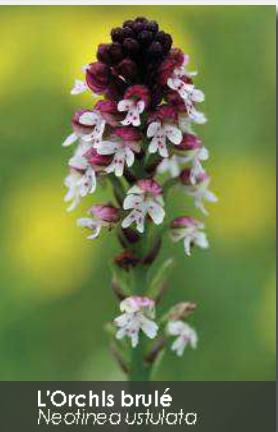
L'Orchis brûlé Neotinea ustulata