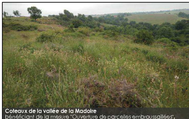
Coteaux de la vallée de la Madolre bénéficiant de la mesure "Ouverture de parcelles embroussaillées".

Les MAEC favorisent la préservation de la vallée dans la mesure où elles évitent au milieu de se refermer et aux espèces protégées d'être détruites. Je les juge utiles dans la mesure où elles permettent de mieux rémunérer les pratiques respectueuses du milieu. "