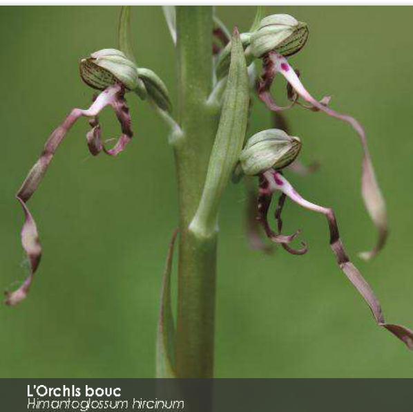
L'Orchis bouc Himantoglossum hircinum