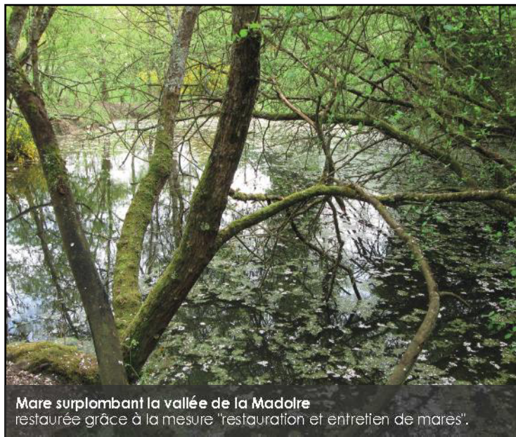
Mare surplombant la vallée de la Madolre restaurée grâce à la mesure "restauration et entretien de mares".