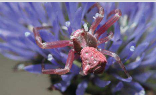
La Thomise enflée Thomisus orustus