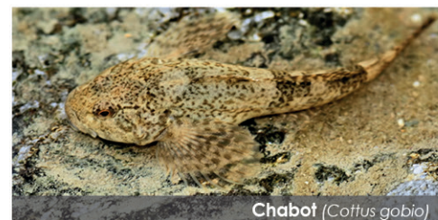
Chabot ( Cottus gobio )