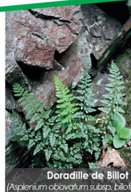
Doradille de Billoit ( Asplenium obovatum subsp. billoiti )