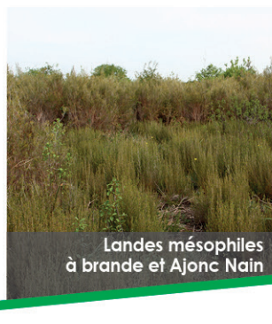
Landes mésophiles à brande et Ajonc Nain