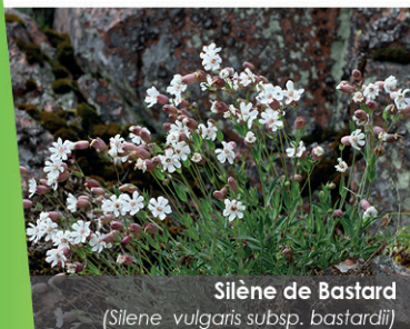
Silène de Bastard ( Silene vulgaris subsp. bastardii )