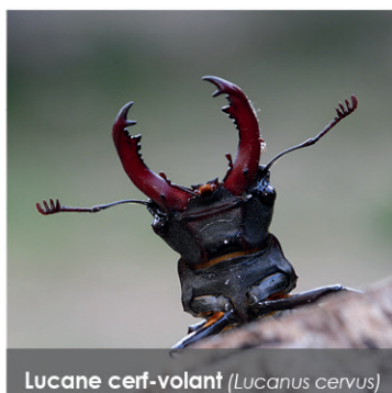
Lucane cerf-volant ( Lucanus cervus )