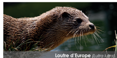
Loutre d'Europe ( Lutra lutra )