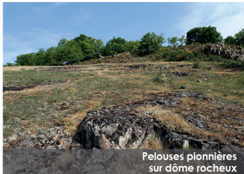
Pelouses pionnières sur dôme rocheux

*Ripisylve : végétation qui se développe sur les berges des cours d'eau .