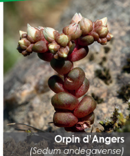
Orpin d'Angers ( Sedum andegavense )