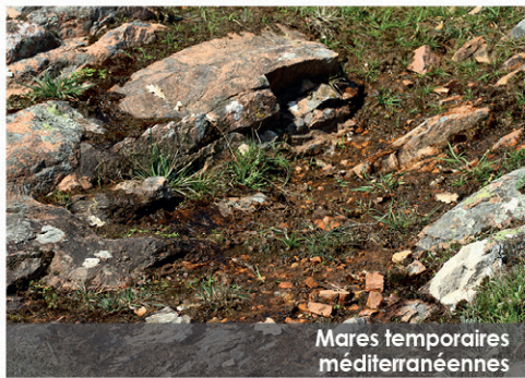
Mares temporaires méditerranéennes

Des corniches rocheuses aux lits des cours d'eau, la vallée de l'Argenton présente une grande diversité de milieux souvent imbriqués les uns aux autres. La Gagée de Bohème orne les sommets de coteaux avant de laisser place à d'autres, spécialistes des suintements et mares temporaires, comme l' Isoète épineux ou l' Ophioglosse des Açores