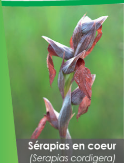
Sérapias en coeur ( Serapias cordigera )