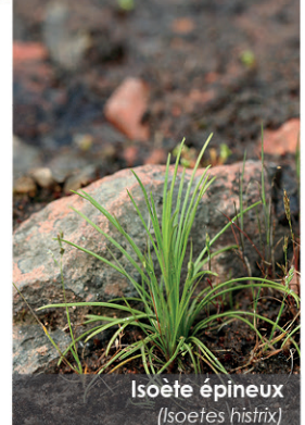
Isoète épineux ( Isoetes histrix )