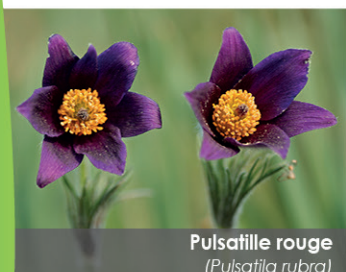
Pulsatille rouge ( Pulsatilla rubra )