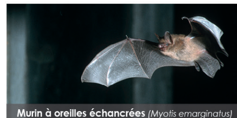
Murin à oreilles échancrées ( Myotis emarginatus )