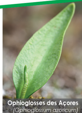
Ophioglosses des Açores ( Ophioglossum azoricum )