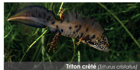
Triton crêté ( Triturus cristatus )