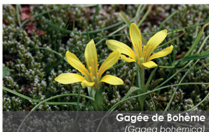
Gagée de Bohême ( Gagea bohemica )