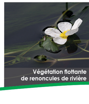
Végétation flottante de renoncles de rivière