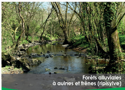
Forêts alluviales à aulnes et frênes (ripisylve)