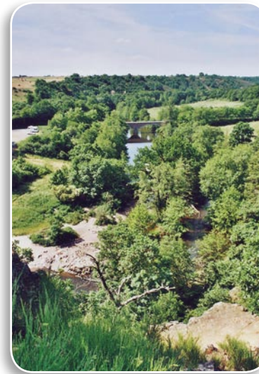
VALLEE DE L'ARGENTON

Ces contrats seront conclus au moins pour 5 ans et pourront prendre deux formes selon qu'il s'agira ou non de terres agricoles :