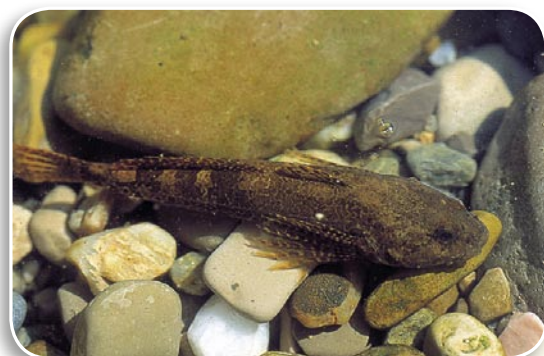
CHABOT DE RIVIÈRE