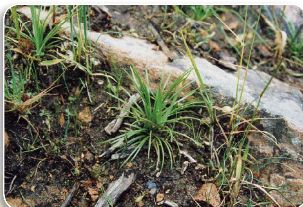
HABITAT DE MARE