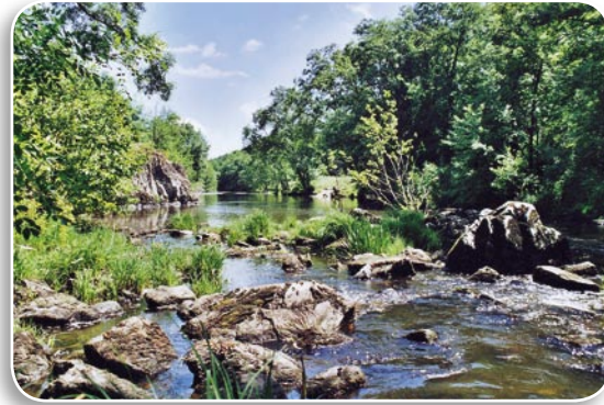
L'ARGENTON A GRIFFERUS

Certaines actions inscrites au Document d'Objectifs seront mises en œuvre par le biais d'un contrat entre l'Etat et l'ayant droit (propriétaire ou gestionnaire) d'une parcelle incluse dans le site Natura 2000. Ce contrat définira les tâches à accomplir pour restaurer ou conserver les habitats naturels. Il précisera les modalités des aides allouées en contrepartie des prestations à fournir : subventions d'investissement ou/et aides annuelles à l'hectare. Un même contrat pourra porter sur plusieurs actions définies dans le Document d'Objectifs.