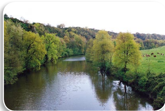
HABITAT DE RIPISYLVE

Les habitats les plus caractéristiques sont les pelouses et landes se développant sur les coteaux siliceux de la vallée de l'Argenton et ses affluents.