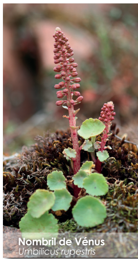
Nombril de Vénus Umbilicus rupestris