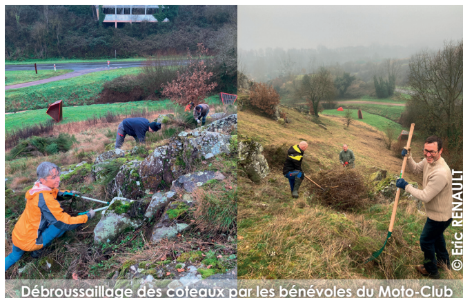
Débroussaillage des coteaux par les bénévoles du Moto-Club

Après la création du site NATURA 2000 en 2003, la commune de Massais a pu signer un premier Contrat NATURA 2000 en 2006 lui permettant d'obtenir des subventions de l'Europe et de l'Etat pour financer un débroussaillage annuel des coteaux. Depuis cette date, et après un quatrième contrat qui vient juste d'être engagé, les travaux sont réalisés par les bénévoles du Moto-Club de Massais. Le principe : la commune signe le contrat NATURA 2000 et reverse les subventions au Moto-Club dans le cadre d'une convention. Ainsi, ce sont 1,8 ha de coteaux qui sont contractualisés au bénéfice de la biodiversité. Les autres parties du site sont gérées et entretenues par la commune.