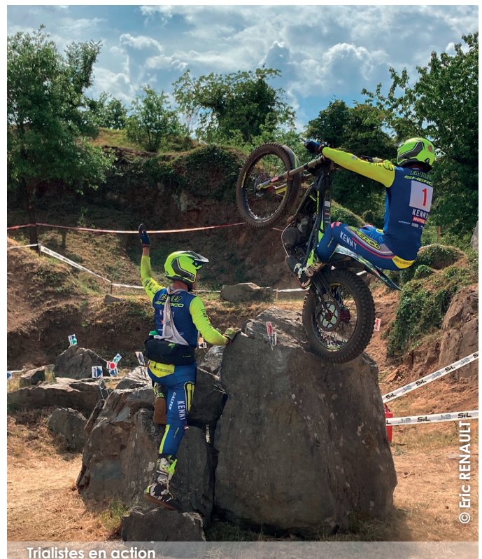
Trialistes en action

Réputés pour leur beauté et la difficulté des parcours, les coteaux des Eboulis de Massais accueillent régulièrement des compétitions de niveau international et national, comme la seconde étape du Championnat de France de Trial 2022, qui s'est tenue les 14 et 15 mai dernier.