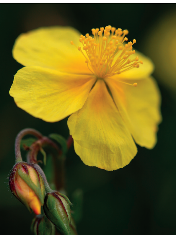
Héliantheme jaune Helianthemum nummularium