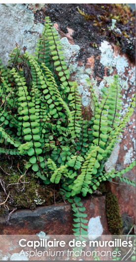
Capillaire des murailles Asplenium trichomanes