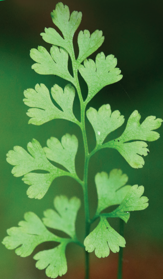
L'Anogramme à feuilles minces ( Anogramma leptophylla )

Le Comité de Pilotage du 17 novembre dernier a permis de dresser un bilan des actions réalisées sur la période 2020-2022. De nombreuses opérations ont ainsi été mises en œuvre, que ce soit pour la préservation des milieux naturels, mais aussi pour la sensibilisation du public et des usagers de la vallée de l'Argenton.