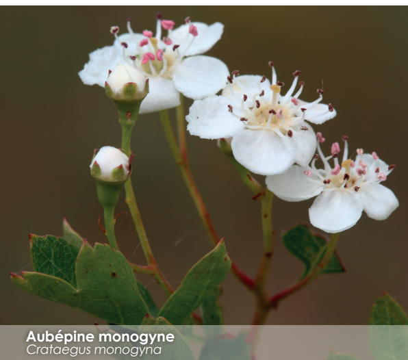
Aubépine monogyne Crataegus monogyna