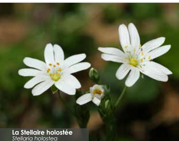
La Stellaire holostée Stellaria holostea