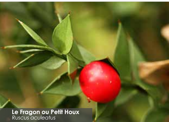
Le Fragon ou Petit Houx Ruscus aculeatus