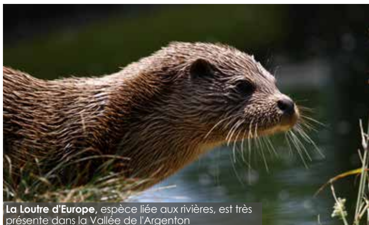
La Loutre d'Europe , espèce liée aux rivières, est très présente dans la Vallée de l'Argenton

Ce bilan se révèle très positif quant à la mise en œuvre des actions mais plusieurs habitats et espèces d'Intérêt Communautaire restent fragiles. De nombreuses actions ont été engagées, mais le contexte réglementaire freine la mise en œuvre de certaines, comme la contractualisation. Il est donc indispensable de maintenir et renforcer les moyens nécessaires à la préservation et la valorisation du site NATURA 2000 de la vallée de l'Argenton.