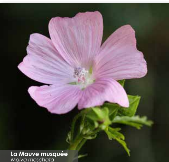
La Mauve musquée Malva moschata