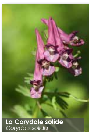
La Corydale solide Corydalis solida