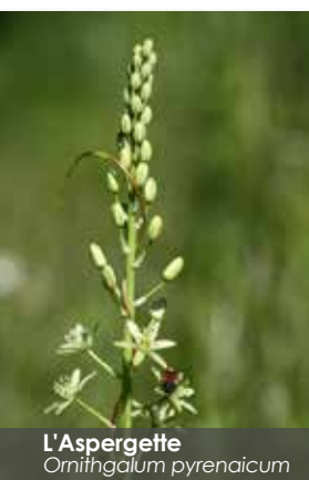
L'Aspergette Omithogalum pyrenaicum