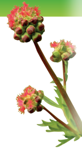
Petite pimprenelle Poterium sanguisorba